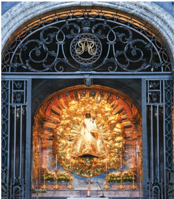
▲ Figura Matki Bożej w opactwie w Einsiedeln